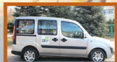
Социальное такси 48-31-77